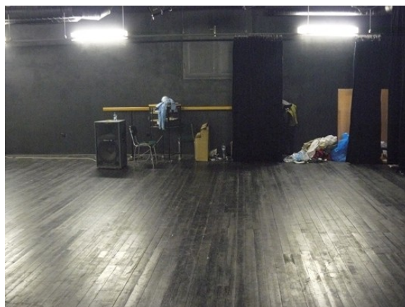
fotka č. 4