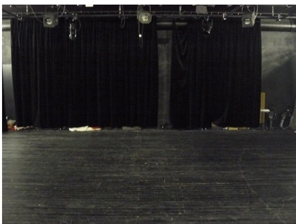
fotka č. 1 (pohled na jevištní plochu)