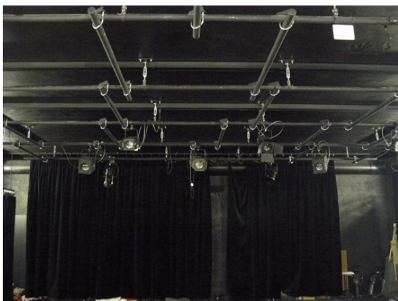
fotka č. 5 (pohled na technologický rošt)