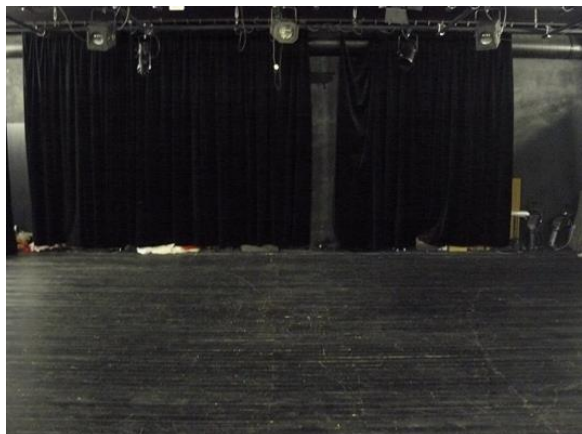
fotka č. 1 (pohled na jevištní plochu)