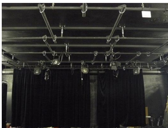
fotka č. 5 (pohled na technologický rošt)