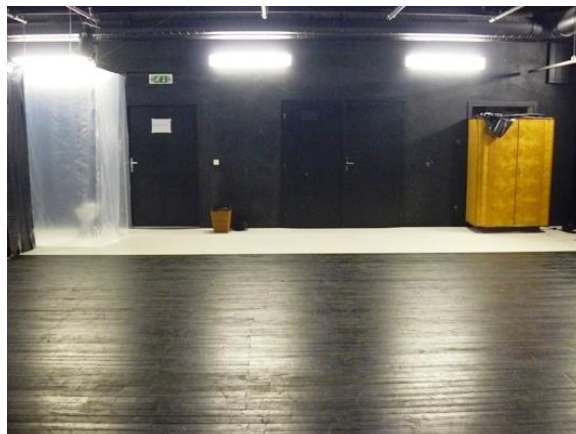
fotka č. 2 (pohled na hlediště)