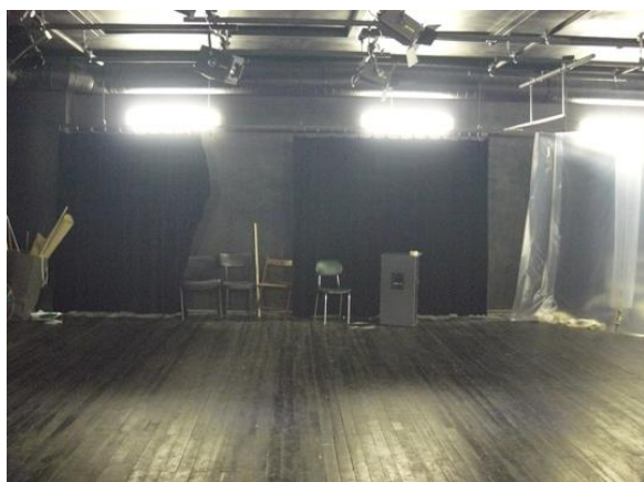
fotka č. 3 (strany jeviště)